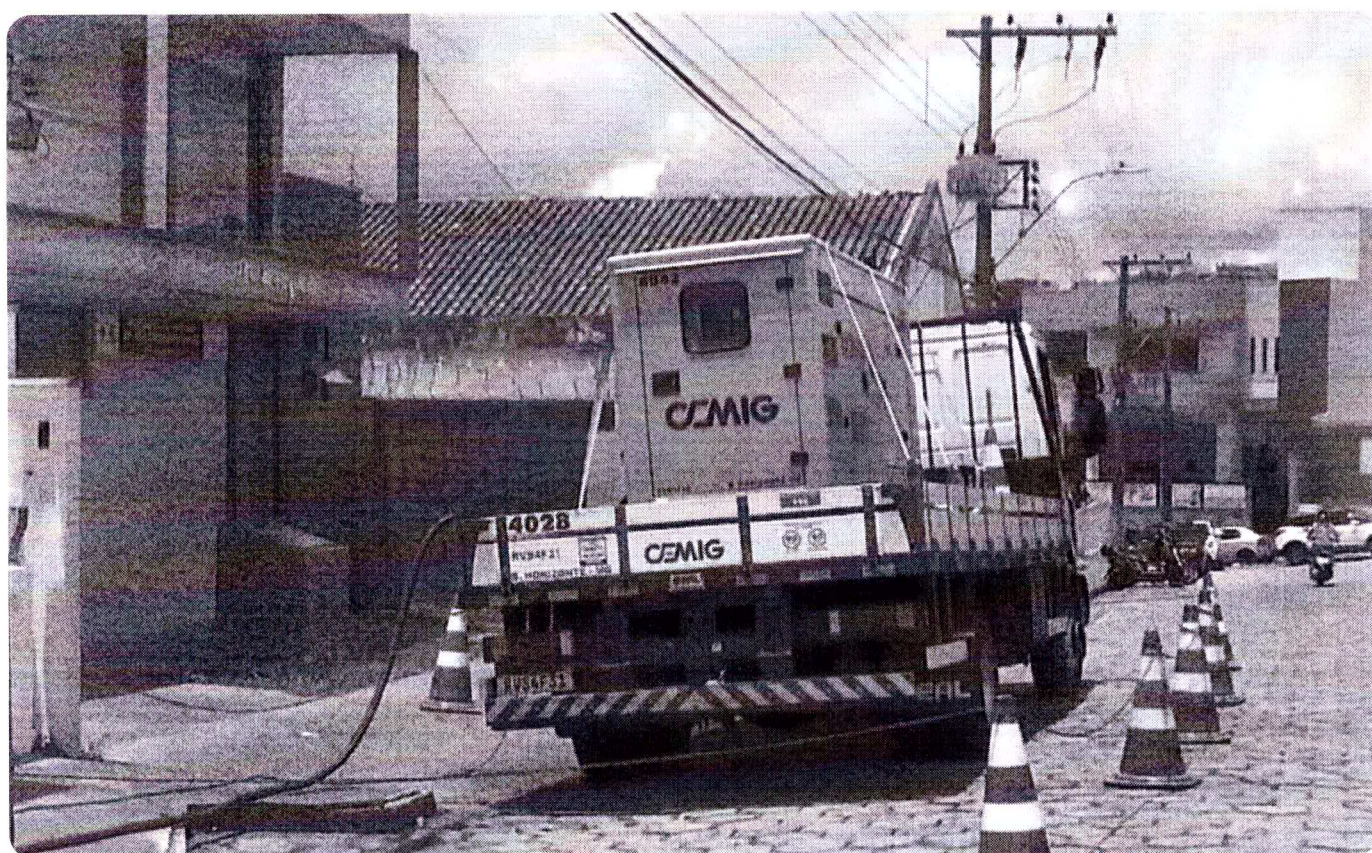
Prefeitura de Alpinópolis (MG) decreta situação de emergência após temporal

O uso desse sistema traz limitações, já que oscilações são constantes; a energia chega a voltar e cair novamente, causando preocupação entre moradores e comerciantes, que trabalham com receio de novos apagões.